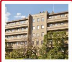
TKP品川 カンファレンスセンター- ANNEX 東京都港区高輪3-13-1 TAKANAWA COURT 3階