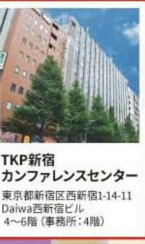
TKP新宿 カンファレンスセンター 東京都新宿区西新宿1-14-11 Daiwa西新宿ビル 4~6階（事務所：4階）